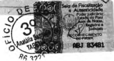
Tabela Escrivente autorizado

TE DE CASTRO CAROLU Escrivente Autorizada